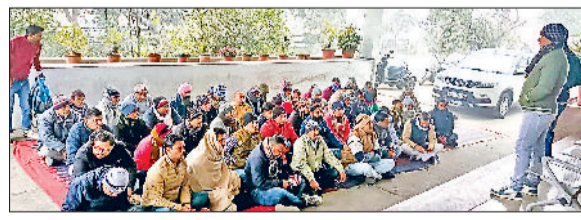
धरनार्थियों को संबोधित करते वक्ता।