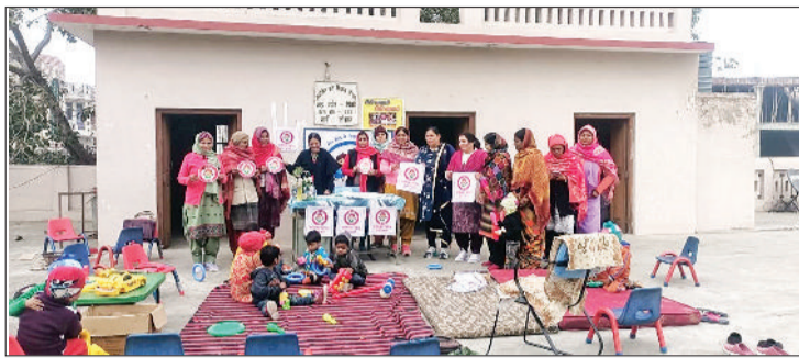
हरिभूमि न्यूज ॥ तोशाम

राष्ट्रीय बालिका दिवस की पूर्व संध्या पर मंगलवार को महिला एवं बाल विकास विभाग द्वारा तोशाम के पंचायत भवन में स्थित आंगनवाड़ी केंद्र पर कार्यक्रम आयोजित किया गया। इस दौरान विभाग की तरफ से सार्वजनिक स्थानों पर बेटी बचाओ बेटी पढ़ाओ स्लोगन के पोस्टर लगाकर आमजन को जागरूक किया। वहीं मौजूद बालिकाओं तथा महिलाओं को शपथ भी दिलाई गई।