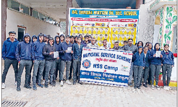
भिवानी। एनएसएस कैम्प के समापन पर स्वयंसेवक।