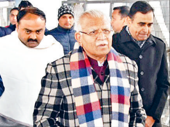
पानीपत रेलवे स्टेशन पर पहुंचे मुख्यमंत्री मनोहर लाल, साथ में भाजपा जिलाध्यक्ष दुष्यंत भट्ट।

मुख्यमंत्री मनोहरलाल मंगलवार को चंडीगढ़ से जन शताब्दी एक्सप्रेस के माध्यम से पानीपत पहुंचेंगे। पानीपत स्टेशन पर पहुंचने पर जिला प्रशासन की ओर से उपायुक्त डॉ. वीरेंद्र दहिया ने के माध्यम से मुख्यमंत्री का बुके देकर स्वागत किया। भाजपा जिला अध्यक्ष दुष्यंत भट्ट ने भी पानीपत के रेलवे स्टेशन पर मुख्यमंत्री का स्वागत किया। मुख्यमंत्री मनोहरलाल पानीपत सड़क के माध्यम से रोहतक के लिए रवाना हुए। इससे पहले मुख्यमंत्री लाल