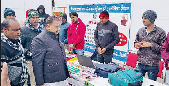
भिवानी। स्टॉलों का निरीक्षण करते विधायक सराफ।