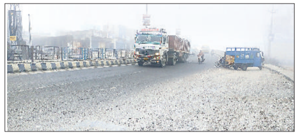
कुरुक्षेत्र। सुबह आसमान में छाई धुंध व अपने गंतव्य की ओर जाते वाहन चालक।

जिला में मंगलवार को भी ठंड का सितम जारी रहा। शीतलहर के कारण हर कोई ठंड से बचने के उपाय ढूंढता दिखाई दिया। ठंड से बचने के लिए ज्यादातर दुकानदारों ने अलावा जलाया। शीतलहर बेजुबान पशुओं पर भी भारी पड़ रही है। सड़कों बेजुबान पशुओं पर धूम रहे पर भी भारी गोवंश के लिए पड़ रही यह ठंड खतरा साबित हो