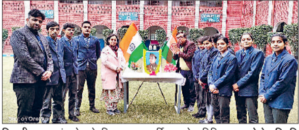
भिवानी। सुभाषचंद्र बोस के चित्र पर पुष्प अर्पित करते अतिथि।