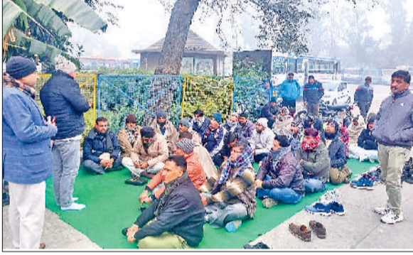
कुरुक्षेत्र। रोडवेज कर्मियों को संबोधित करते यूनियन नेता।

की परिवहन मंत्री व उच्च अधिकारियों के साथ 11 जनवरी, 10 मार्च, 23 जून व 13 दिसम्बर को चार दौर की बातचीत हो चुकी है। सरकार कर्मचारियों की मांगों को जायज मानती है जिन्हें शीघ्र लागू करने का आश्वासन देती रही है परंतु मानी गई मांगों के परिपत्र जारी नहीं